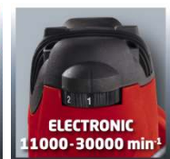
ELECTRONIC 11000-30000 min -1