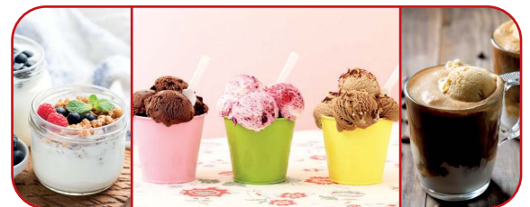
Eiskalt genießen – ganz nach Ihrem Geschmack

Farbe: weiß Artikel-Nr.: 263 994 Artikel EAN-Code: 4 006 160 639 940 Exportkarton EAN-Code: 4 006 160 587 890