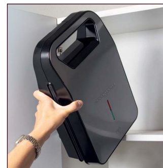
Platzsparende Lagerung durch aufrechten Stand