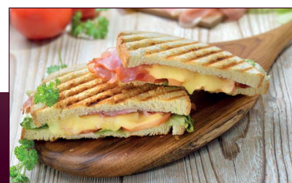
Sandwich-Genuss individuell nach Ihrem Geschmack