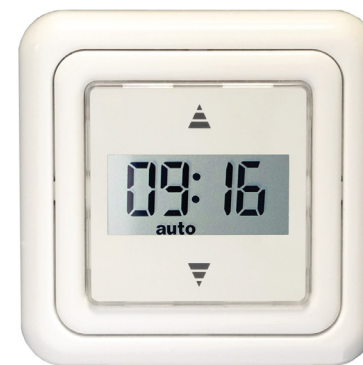
Abb.1: Art. 320050