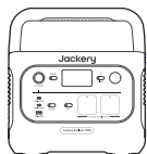
Jackery Explorer 1000