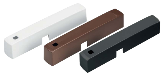
Farbvarianten in Weiß, Braun und Anthrazit