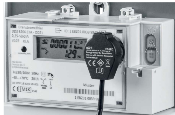
Montage an einem Stromzähler

Übertragen werden alle Zählerstände sowie die Momentanleistung. Das Gerät lässt sich in Verbindung mit Bezugs- und Lieferzählern, Zweirichtungszählern, Eintarif- und Zweitarifzählern verwenden.