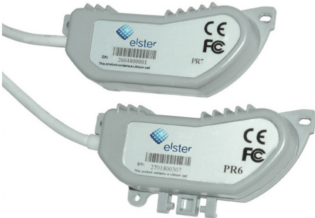
PR6/PR7 Falcon Kommunikationsmodul

Der Falcon M-Bus ermöglicht die Auslesung von Elster Wasserzähler (mit Falcon Zählwerk) in einem M-Bus System. Dazu wird der Aufsatz auf den entsprechend vorbereiteten Wasserzähler montiert. Die Volumenpulse werden vom Falcon M-Bus zu einem Volumenzählerstand aufaddiert.